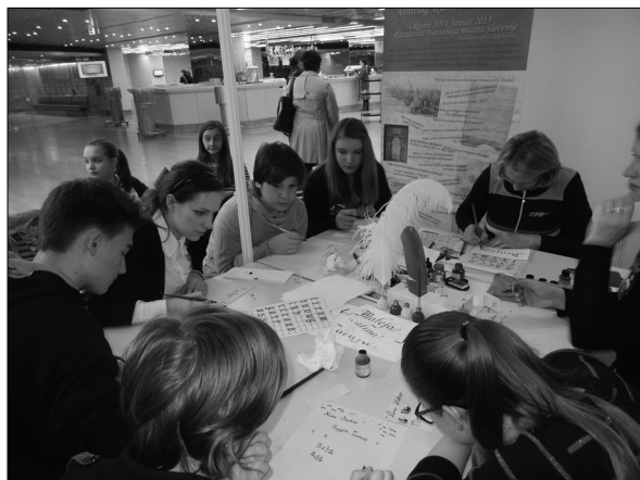
Kaligrafska delavnica na Kulturnem bazarju