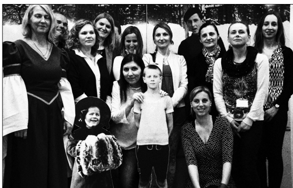
Arhivski fotografski atelje in predstavniki arhivov na Kulturnem bazarju 2015 14

predavanj, pri katerih so arhivi sodelovali v preteklih letih. Leta 2015 pri treh sklopih: